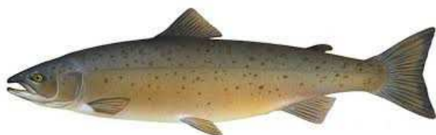
Atlantischer Lachs Fisch des Jahres 2019