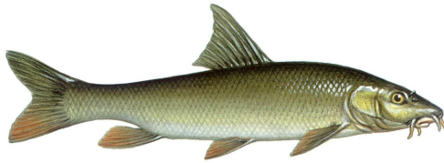
Barbe Fisch des Jahres 2022